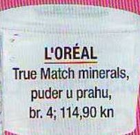
L'ORÉAL True Match minerals, puder u prahu, br. 4; 114,90 kn