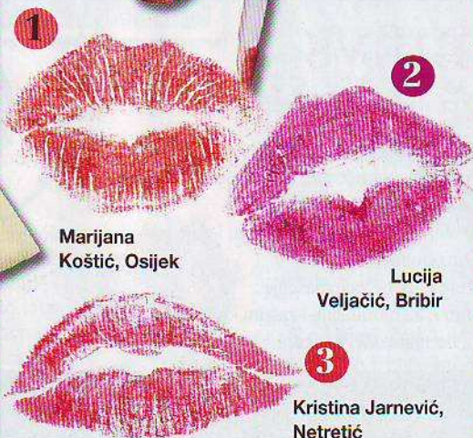
1 Marijana Košćić, Osijek